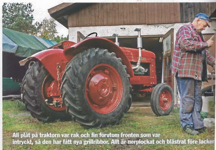
All plåt på traktorn var rak och fin förutom fronten som var intryckt, så den har fått nya grillribbor. Allt är nerplockat och blästrat före lackering.