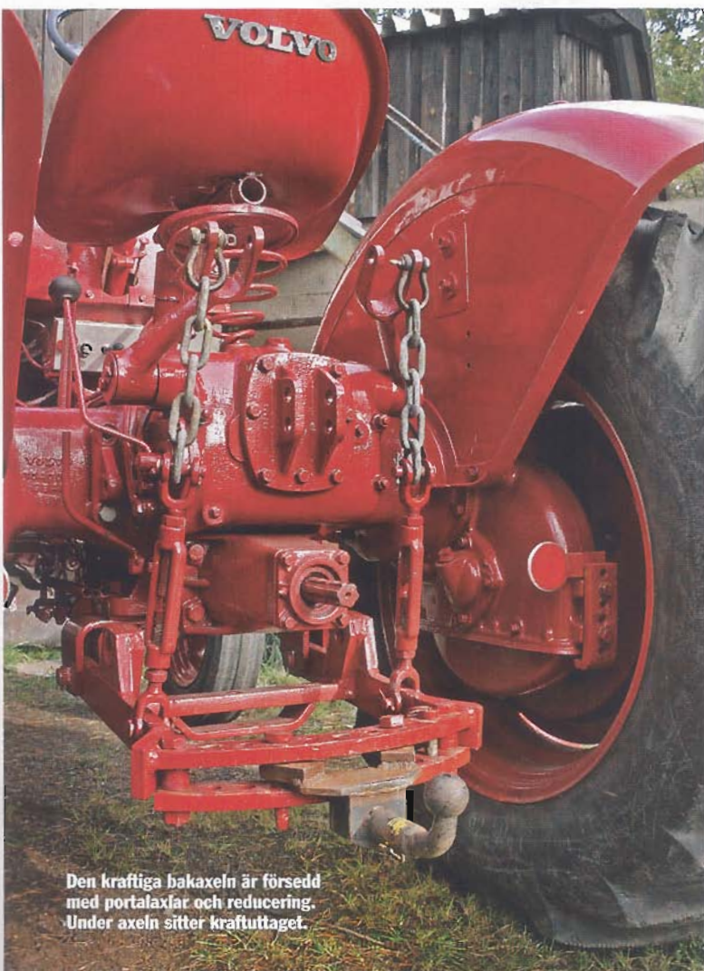
Den kraftiga bakaxeln är försedd med portalaxlar och reducering. Under axeln sitter kraftuttaget.