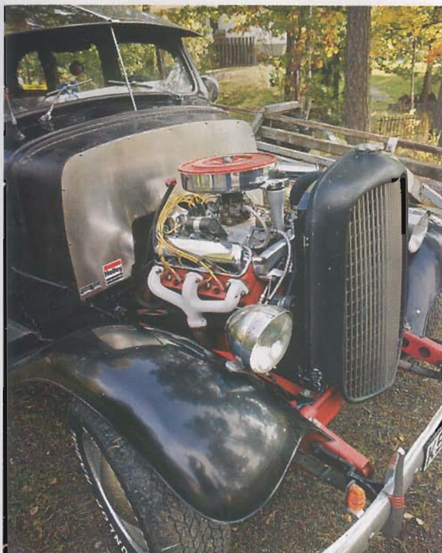
Palle fick upp ögonen för Volvos okända V8 för många år sedan då han monterade en L420-8 i sin kraftigt ombyggda Volvo Sugga från 1951.

att få avgaserna rakt upp. Generatorm sitter fast monterad i ramen och har fått en spärrulle för remmen.