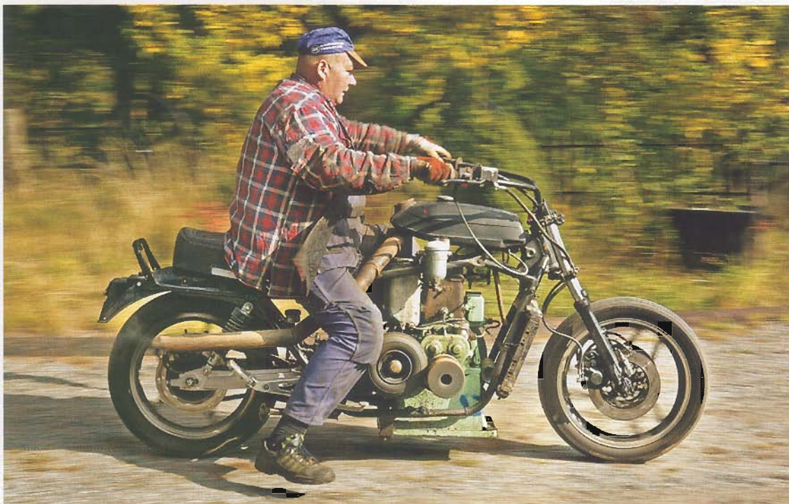
"Farsan höll på med en Folka med tändkula och visste ingenting så han blev rätt paff när jag dunkade in på trädgårdsgången hemma hos honom med hojen." Tändkulan från Skandia på 3 hk sitter i en ram från en Suzuki 1100. Drivningen går via ett hjul från en pirra som förs in mot motorns remhjul med en "växelspak" av modell bandjärn.